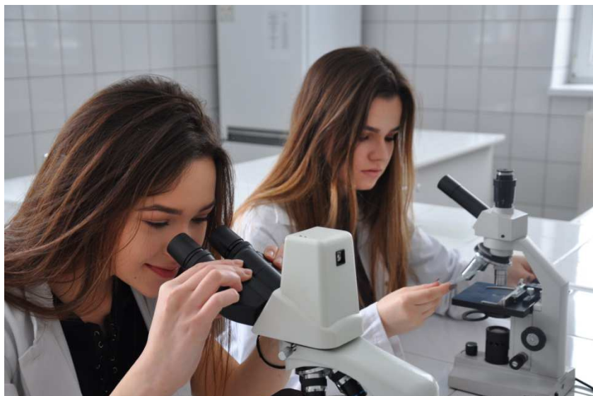
Fot. Zajęcia praktyczne w Gabinetie Weterynaryjnym