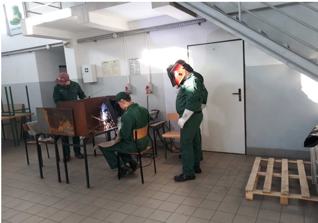
Fot. Kurs spawacza