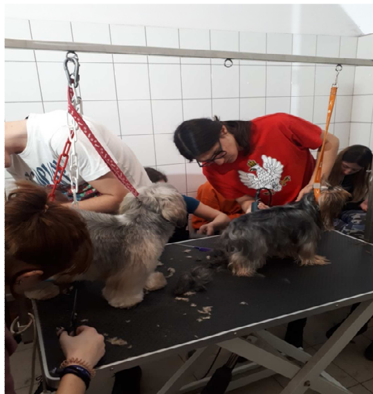
Fot. Kurs groomingu