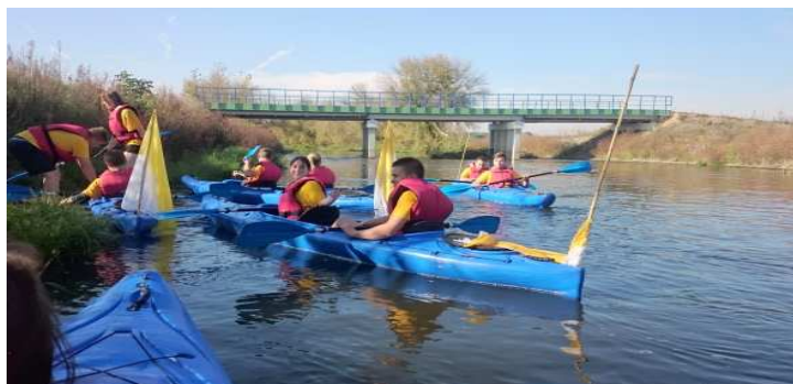
Fot. Spływ kajakowy