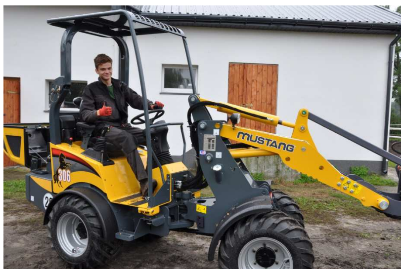
Fot. Zajęcia praktyczne z techniki w rolnictwie

Szkoła wychodzi naprzeciw aktualnym potrzebom i kształci techników rolników o różnych specjalnościach. Dobre przygotowanie ogólnorolnicze i specjalność branżowa umożliwi absolwentom łatwe przystosowanie się do warunków w każdym zakładzie pracy związanym bezpośrednio lub pośrednio z rolnictwem. Po ukończeniu szkoły uczniowie mają możliwość podjęcia studiów wyższych na kierunkach: rolnictwo, zootechnika, technika rolnicza, ekonomia, agrobiznes i innych.