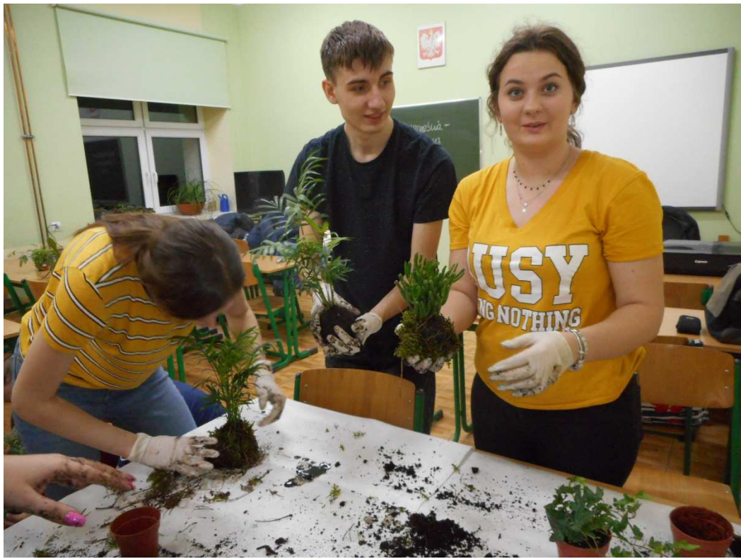
Fot. Kurs florystyczny