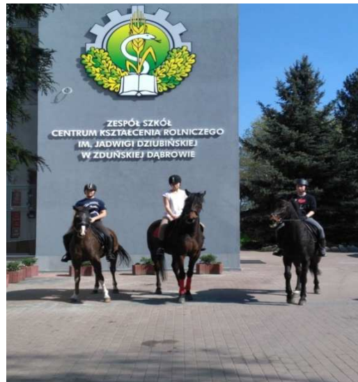
Fot. Kurs instruktora jazdy konnej